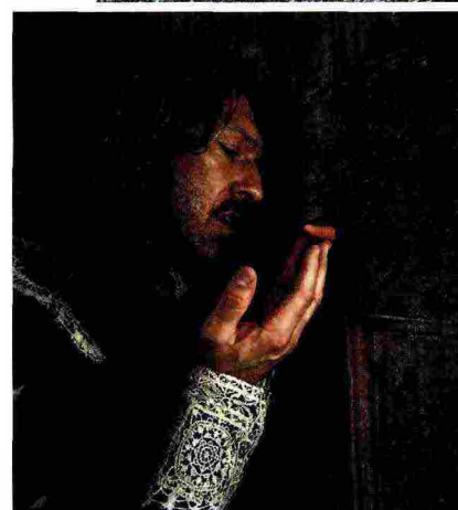
A moment during the film's shoot; several scenes from the film Un momento delle riprese del film; alcune scene del film