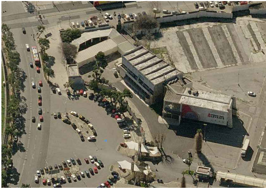
VISTA DALL'ALTO - LATO NORD - OVEST