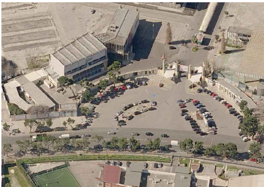
VISTA DALL'ALTO - LATO OVEST