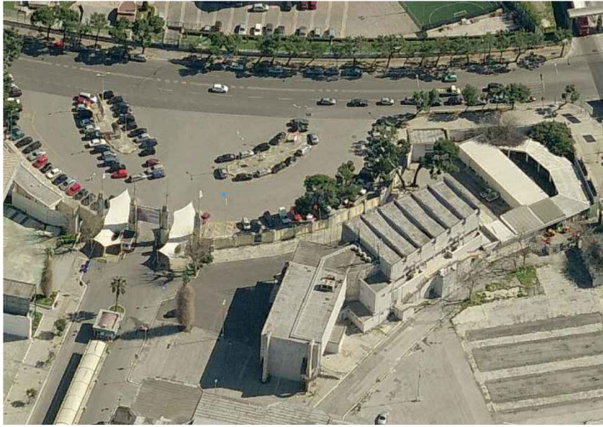
VISTA DALL'ALTO - LATO NORD

Comune di Bari Regione Puglia Fondazione Apulia Film Commission