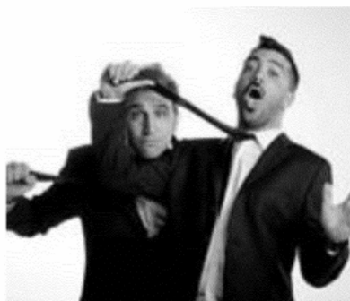
Pio e Amedeo al debutto su grande schermo