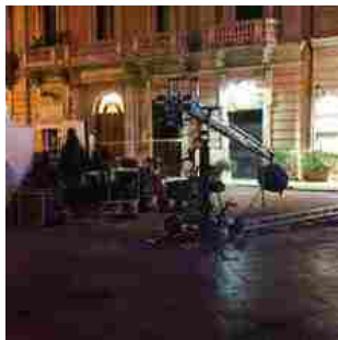
Il set in Corso Cavour - Foto Massimo Danza

U n set televisivo nel cuore della città. Hanno preso il via ieri sera in Corso Cavour le riprese della serie tv 'Il Sistema', prodotta dalla Italian International Film e Rai Fiction.