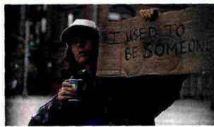
DALL'ALTO DA SINISTRA: UNA SCENA DI EX MACHINA ; IL MANIFESTO DEL FESTIVAL; UNA SEQUENZA DI SHELTER

nale parteciperanno 12 titoli prodotti nell'ultimo anno e ancora inediti in Italia, tra cui il film d'apertura Tempo instabile... con probabili schiarite di Marco Pontecorvo e il drammatico Shelter diretto dall'esordiente Paul Bettany e interpretato da Jennifer Connelly. I titoli di quest'ultima sezione saranno giudicati da una giuria composta da 30 spettatori e presie-