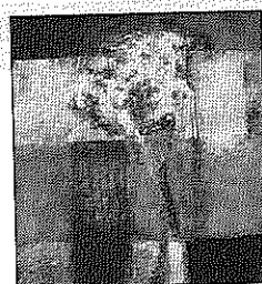
Un'opera di Frigieri al quale è dedicata una personale al Cineporto di Bari

Al Cineporto di Bari s'inaugura oggi la personale "Simboli della memoria" di Fabio Frigieri, realizzata dall'associazione "Vera Arte" in esclusiva per il Cineporto (fino al 5 novembre, ingresso libero dal lunedì al giovedì dalle 10 alle 13 e dalle 15 alle 18). L'artista bolognese ha operato con Aurelio Barbalonga, Alcide Fontanesi, Metauro Ruggeri e dal 2001, lavora con Roberto Canaider.