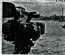
► Set cinematografico

■ Mettere le produzioni che intendono girare film in Puglia nelle condizioni di trovare le maestranze sul posto, risparmiando sul costo per le diarie, è uno dei compiti dell'Apulia film Commission. L'agenzia si occupa di erogare servizi per le produzioni che girano in Puglia: ricerca location, laboratori di post