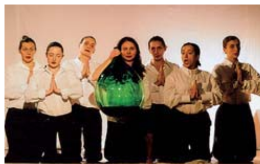
La compagnia Astragali in scena con «Lysistrata»