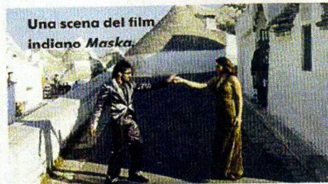
Una scena del film indiano Maska.

Bollywood, sempre in cerca di nuove location, ha scoperto la Puglia, e ci si è trovata benissimo. Tra i trulli di Alberobello e le spiagge del Gargano, negli ultimi due anni sono stati girati già tre film indiani. L'ultimo ( Housefull ) proprio questo mese: «Welcome in the most beautiful place in the world. Apulia», dice l'albergatore in una scena ambientata in un hotel di Baia delle Zagare alla coppia in viaggio di nozze, impersonata dalle star Akshay Kumar e Deepika Padukone.