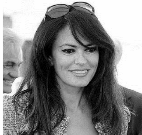
ATTORI Enrico Lo Verso e a sinistra Maria Grazia Cucinotta che sono stati a Bari e in provincia

gliese Draka production , ed è incentrato sull'impegno civile e sul giornalismo coraggioso che si oppone al degrado sociale e morale causato dalla criminalità. Lo Verso interpreta la figura di Domenico Riva , stima-