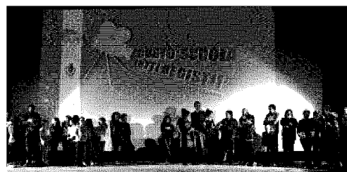
La presentazione di "Corto scuola tutti registi"

"Friendly Floatees" della scuola "Salvemini - Virgilio", che rac-