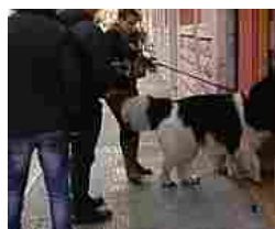
Bari, in azione gli 007 delle cacche dei cani