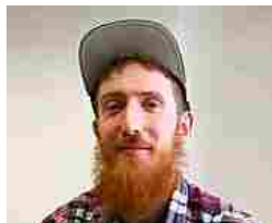
10 trucchi infallibili che ti faranno imparare qualsiasi lingua