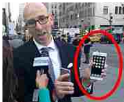
I commercianti lo odiano! Non vogliono farti scoprire questo segreto dello...