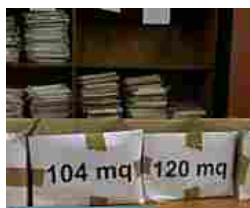
Ponticelli, la gioia per l'assegnazione della casa