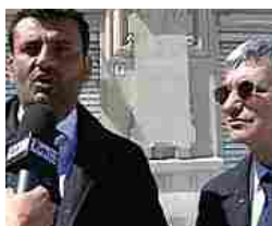
Kursaal, Decaro e Vendola: 'Si completa il mosaico della cultura'