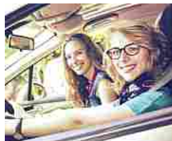
Fenomeno BlaBlaCar: già 10 milioni di utenti. Iscriviti ora.