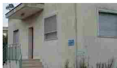
Brindisi Località contrada Marrafina Via Marie Curie 30 - 156500 €