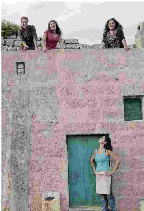
EMOZIONI «In grazia di Dio» di Winspeare