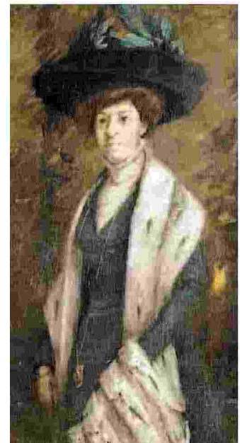
SARGENT Tra gli autori di "Persone", a dicembre in pinacoteca a Bari