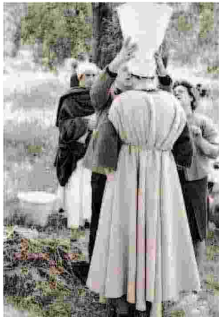
PASOLINI A Matera l'omaggio a 50 anni dal "Vangelo secondo Matteo"