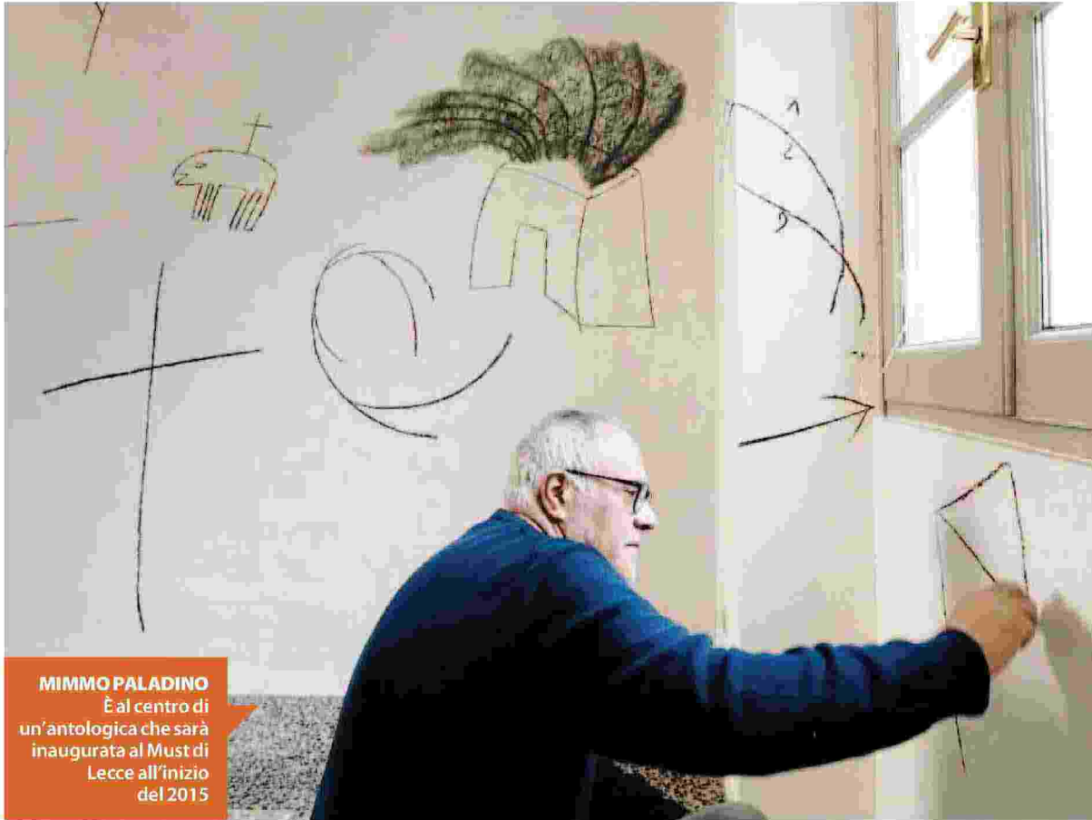
MIMMO PALADINO È al centro di un'antologica che sarà inaugurata al Must di Lecce all'inizio del 2015