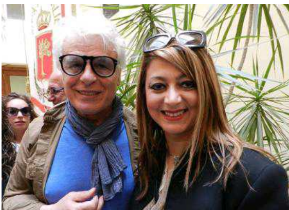
Guarda la gallery

“Aspettate di vedere il film”, ha ribattuto scherzosamente l'indimenticato commissario Cattani, uno degli attori e registi più popolari del grande e piccolo schermo italiano, accolto con grande calore. “Ho scelto Bisceglie come location per il mio prossimo film perché sono stato folgorato dal suo centro storico, da palazzo Tupputi ai palazzi nobiliari. Ho sentito di recente Veronesi e Verdone i quali mi hanno detto “ah giri in Puglia, bella Trani, vero?” No, gli ho risposto, giro a Bisceglie.