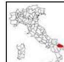
Polignano a Mare