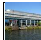
Arte (rete televisiva)