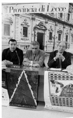
IERI La presentazione