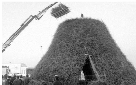
TRADIZIONI Gru in azione per la grande «fòcara» di Sant'Antonio abate