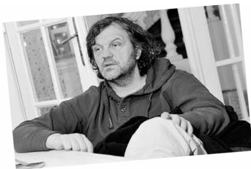
PRESENZE DOC Il regista Emir Kusturica e, in basso, Idetoshi Nagasawa che «firma» la grande Fòcara 2014 a forma di cono