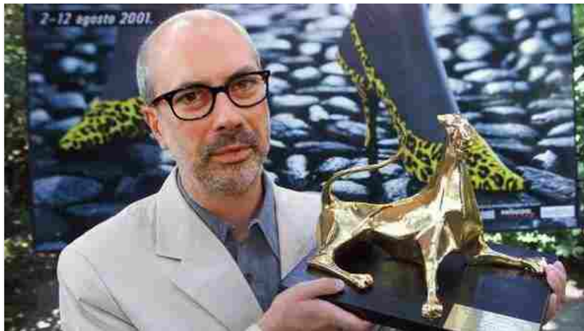
Apulia film Commission, Sciarra president