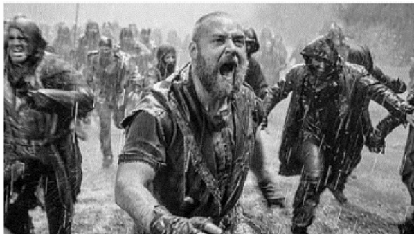
LE ANTEPRIME DEL BIF&ST Una scena del film «Noah» con Russel Crowe e (sotto) Woody Allen con John Turturro in «Gigolò per caso»

I l Bif&st ai nastri di partenza. Si cominciano a conoscere i titoli dei film che animeranno la quinta edizione del festival di Bari ideato e diretto da Felice Laudadio e che quest'anno si terrà dal 5 al 12 aprile. Noah diretto da Darren Aronofsky , e Gigolò per caso (Fading Gigolo) diretto da John Turturro , sono i film che, rispettivamente, apriranno e chiuderanno le «Anteprime internazionali». C'è grande attesa per il festival presieduto da Ettore Scola .