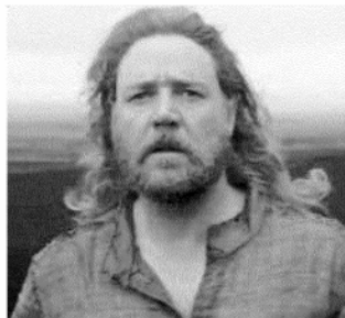
Russell Crowe in Noah