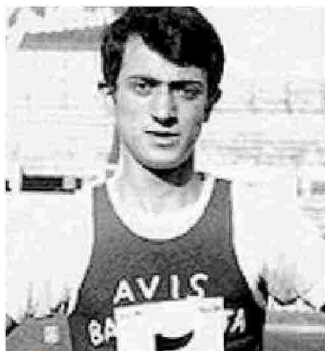
GIÀ STAR Pietro Mennea

cronista queste parole di Pietro Mennea a fine del 2002 negli uffici del Parlamento europeo di Bruxelles quando su tutti i giornali nazionali ed stranieri fu pubblicata la notizia. E allora roteando il caleidoscopio della fantasia, anche per chi scrive, non è stato difficile visualizzare Pietro ieri mattina allo stadio «Lello Simeone» durante le riprese del film «La freccia del Sud» diretto da Ricky Tognazzi e sceneggiatura a quattro mani con Simona Izzo e prodotto da Casanova Multimedia - Rai Fiction con il sostegno finanziario di Apulia film Commission . Michele Riondino indosserà le scarpette di Pietro. Fuori dello stadio in tanti hanno seguito le riprese. Una forma di legittima curiosità - tutta l'area si è trasformata in un set cinematografico con tanto di sartoria dove si