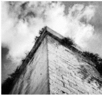
Le mura di Lecce