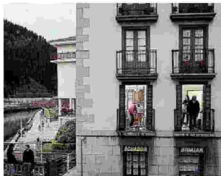
Un'immagine di Giorgio Barrera

Titolo tanto più significativo, in quanto non solo sottolinea l'obiettivo di alimentare il dialogo sul paesaggio urbano, ma contiene un invito riferimento alla «Street memo-