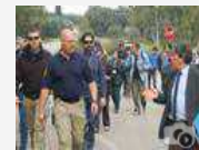
Le foto dell'esercitazione