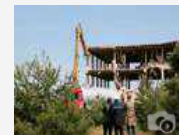
L'abbattimento del mostro di cemento