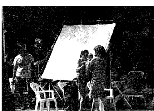
la scena girata nell'acquapark