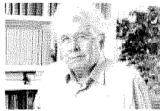
ALEXANDER J. SEILER È l'ospite internazionale