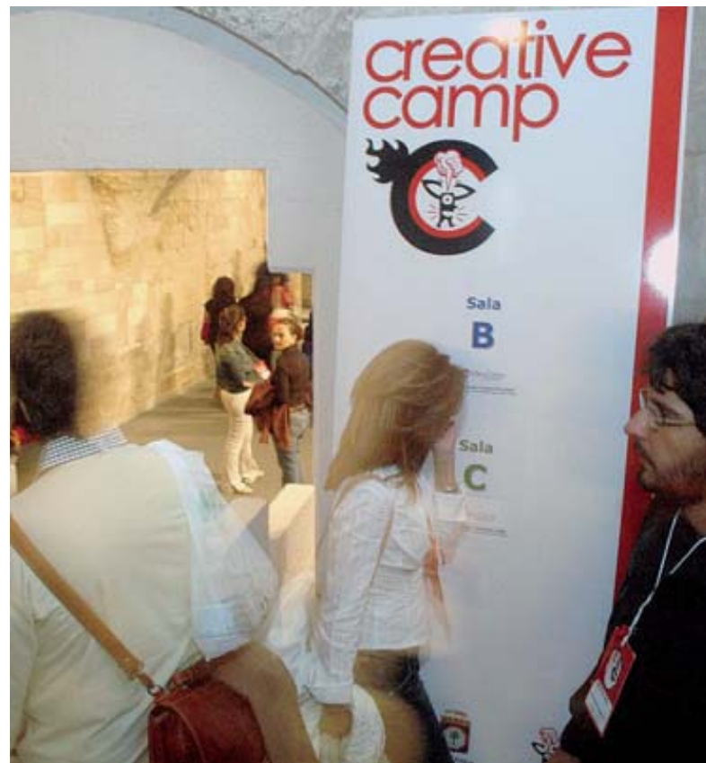
Creative Camp Una delle esperienze di «Bollenti Spiriti», bando che ha preceduto «Principi Attivi»