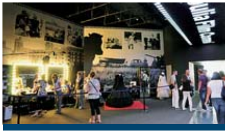
Abiti da film, trucco, camerini e, naturalmente, macchine da presa: l'Apulia Film Commission si presenta così