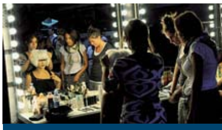
Al trucco per diventare «attrice per un giorno», grazie all'Apulia Film Commission